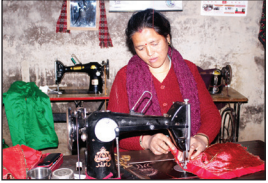
Sushila Rai Silai Byabasai Bidur Nagarpalika