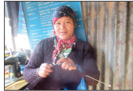
Seti Tamang Pikhuri VDC, Wada No. 7, Nuwakot