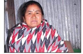
रतिमाया शापानगर अध्यक्ष, जौँडा महिला विकास बहुउद्देश्यीय सहकारी संस्था